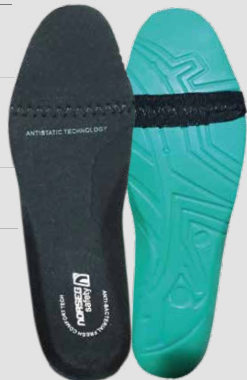
Plantilla interior (tecnología antiestática)

Plantilla con tratamiento ANTIMICOTICO que otorga control de olores y previene de la proliferación de hongos.